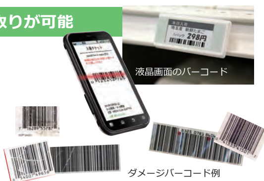
ダメージバーコード例

手入力ミスや様々なエラーを最大限に防止し、生産能力および作業効率の改善に貢献します。