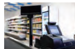
スマートデバイスを活用したPOSシステムとして

PF680BTは、コストパフォーマンスに大変優れており、リテール・物流・流通・FA等の様々なマーケットに最適です。