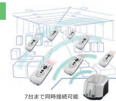
7台まで同時接続可能

バッチスキャンモードでは、データコレクターと同様の運用が可能です。JAN-8の場合、約80,000件のデータを蓄積することができます。