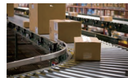
工場・生産ラインにおける生産管理の入力端末として