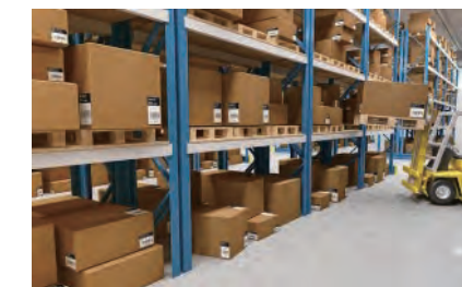
倉庫業務の在庫管理システムの入力端末として