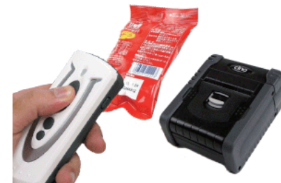
複写ラベルの発行端末として