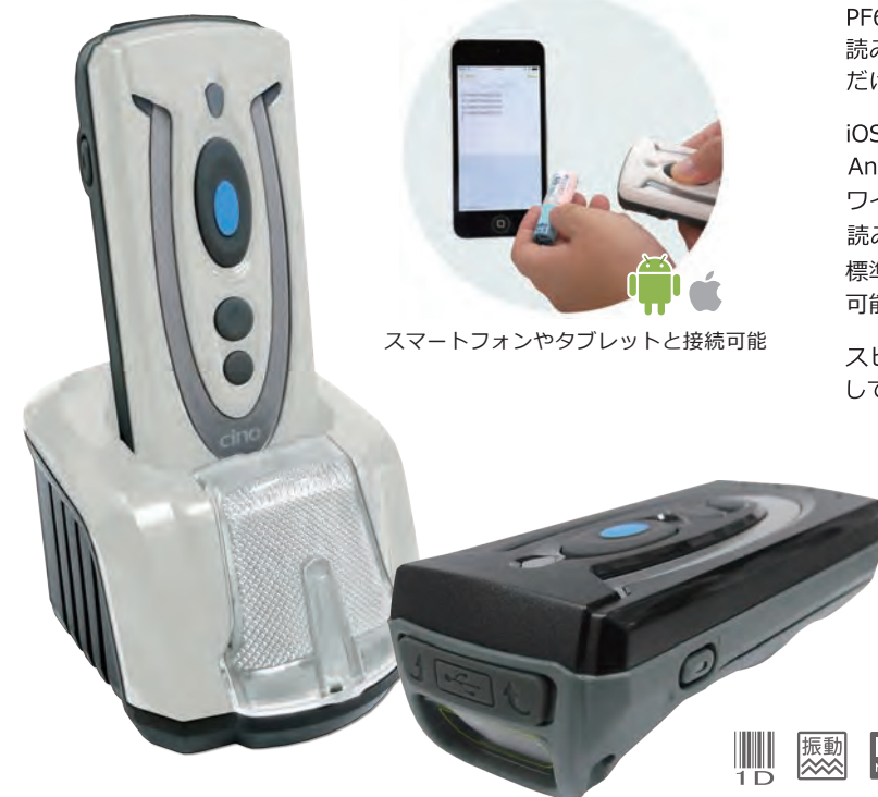
スマートフォンやタブレットと接続可能

PF680BTは、Bluetoothを搭載した小型のワイヤレスバーコードリーダーです。読み取ったデータの蓄積が可能ですので、データコレクターとしてもお使いいただけます。