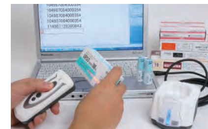
病院・医療分野の管理機器として