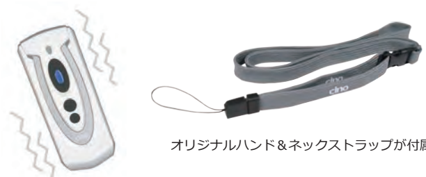
オリジナルハンド&ネックストラップが付属

操作音が出せない静かな環境や工場などの騒音環境でも、読み取り時の振動と、LEDランプの点灯により、確実な読み取り作業が行えます。